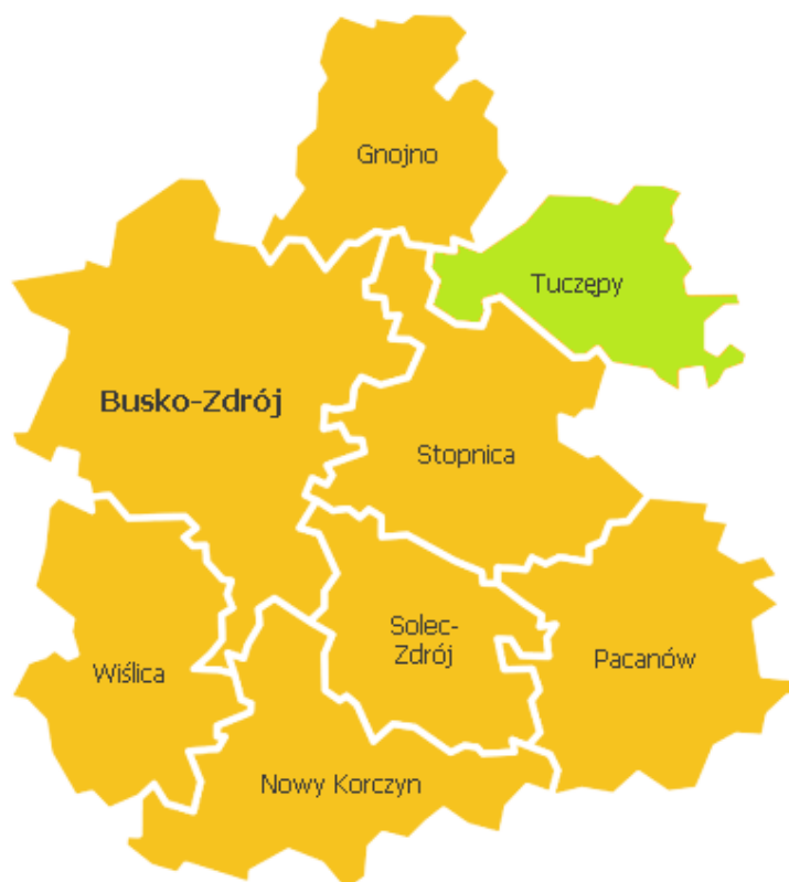
Rysunek 1. Powiat buski